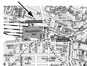
Europäische Akademie Bayern

ca. 21.00 Uhr Ankunft im Hotel, Zimmerverteilung