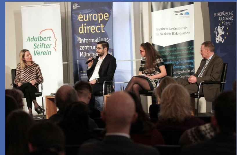
Anschließende Diskussion mit Expert/-innen und Schüler/-innen im Landtag