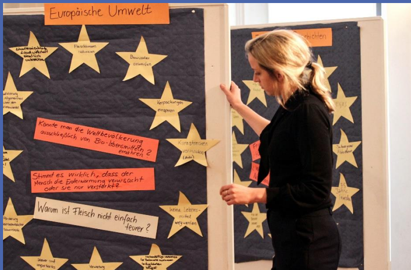
Workshops mit Schulklassen im Gasteig