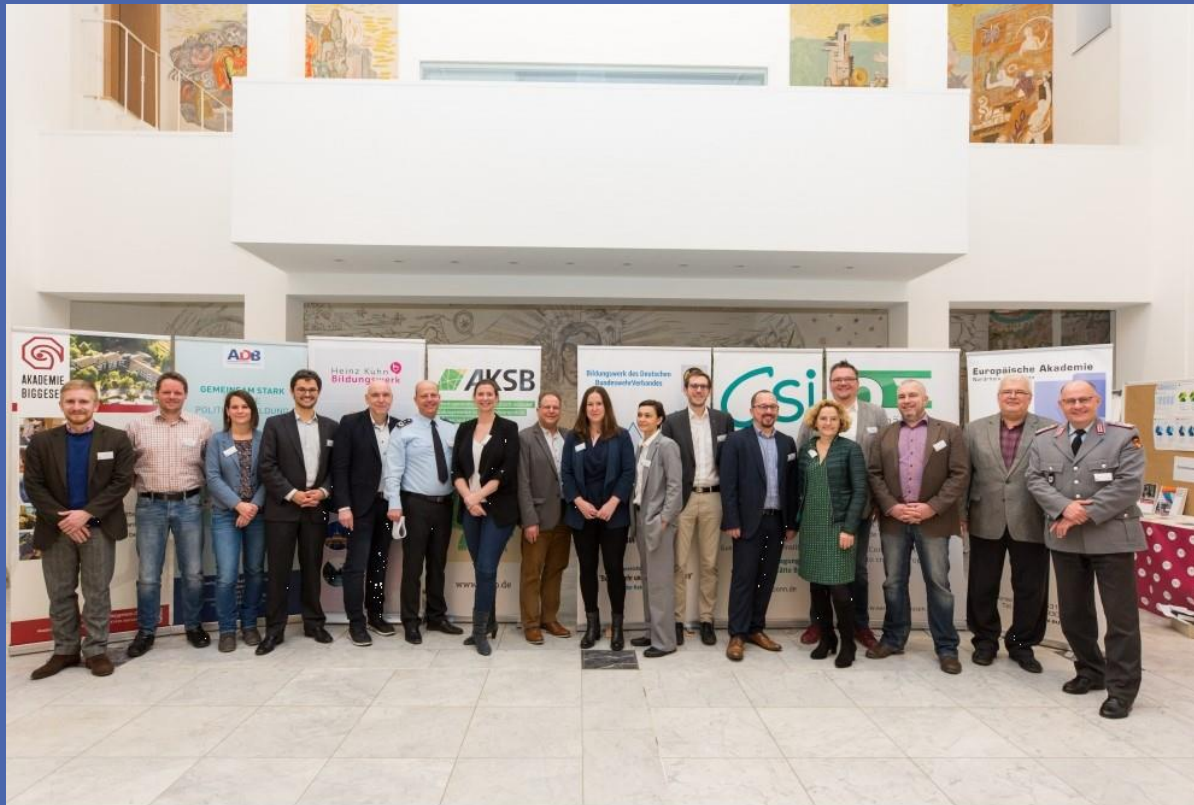
Akteure des "Netzwerks politische Bildung in der Bundeswehr", das den zivil-militärischen Dialog fördert, stellen ihre Arbeit vor.

Die Netzwerkmitglieder haben beim „Markt der Möglichkeiten“ Gelegenheit, ihre bildungspolitischen Angebote zu präsentieren.