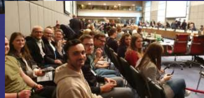
Besuch einer OSZE-Sitzung, Hofburg, Wien