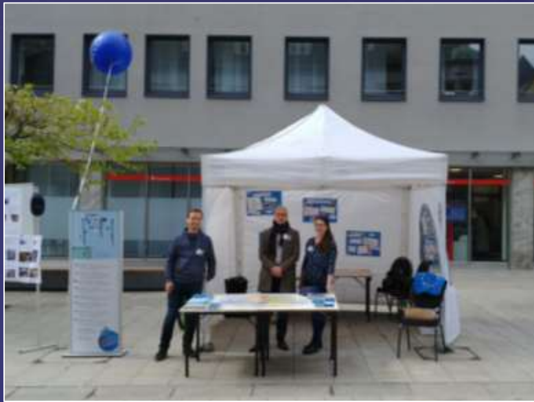
Europatag in Augsburg am 04. Mai 2019