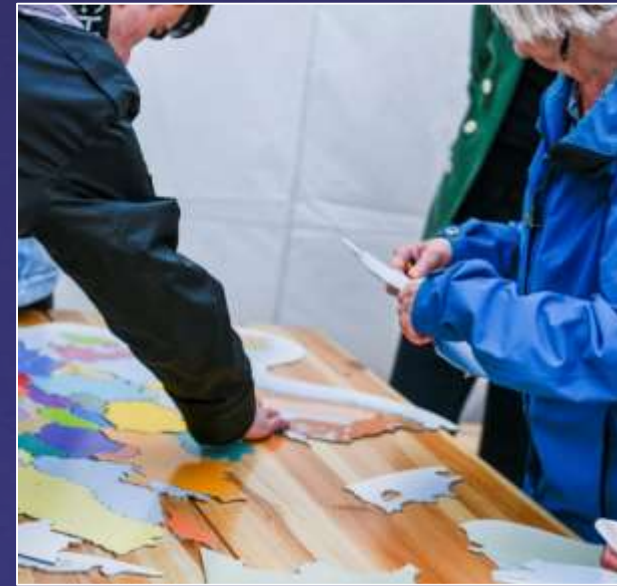
Europatag in München am 09. Mai 2019