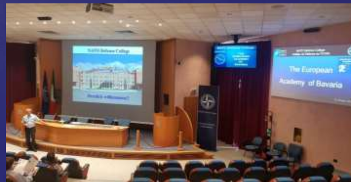
Brigadegeneral Wagner stellt das NATO Defense College vor