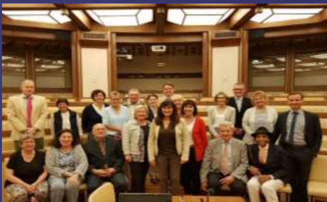
Senatorin Laura Garavini (mitte) erläutert der Gruppe die aktuelle Lage nach der Regierungsbildung

Europaseminar in Rom in Kooperation mit dem Jugendoffizier München (05.10. – 11.10.2019)